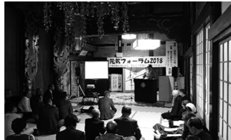
▲浦川原区中保倉 元気フォーラム2018にて講演