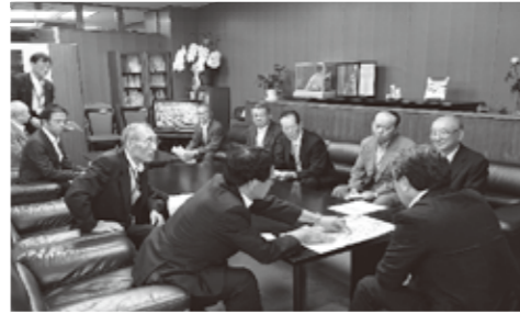
▲上越魚沼地域振興快速道路(安塚・大島間)建設促進期成同盟会(国土交通省)への要望活動