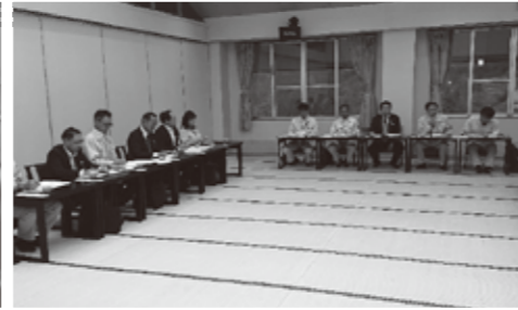
▲平成31年度新潟県土木部関係事業検討会