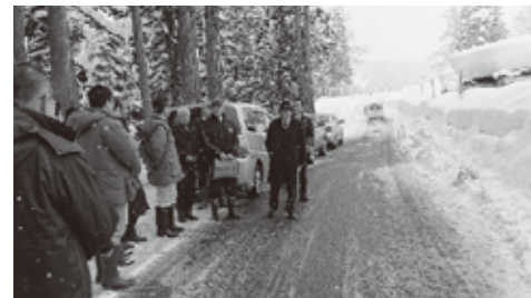
▲牧区県道高尾田島線現地調査