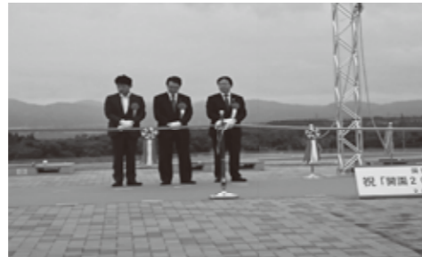
▲国営越後丘陵公園「開園20周年及び遊びの里開園」記念式典