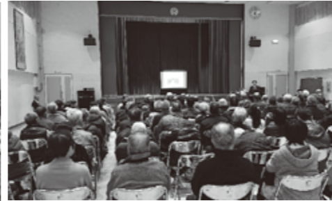
▲安塚区県政報告会